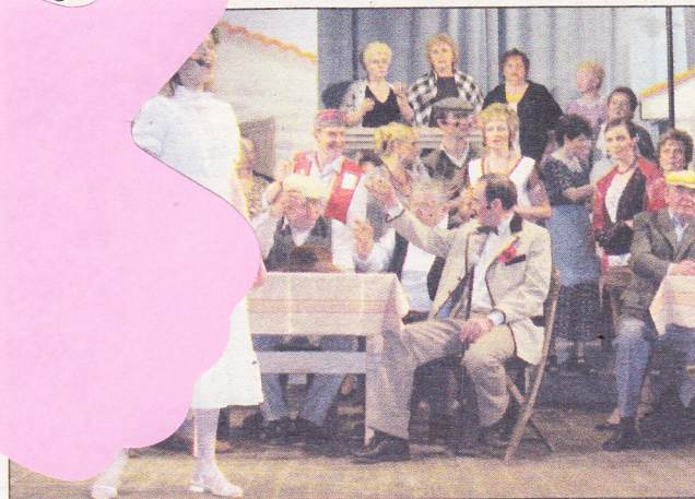
Zvonokosy. Na jevišti se během představení objevilo čtyřiapadesát herců.

Zvonokosy znamenaly mimo jiného také návrat režiséra Mi-