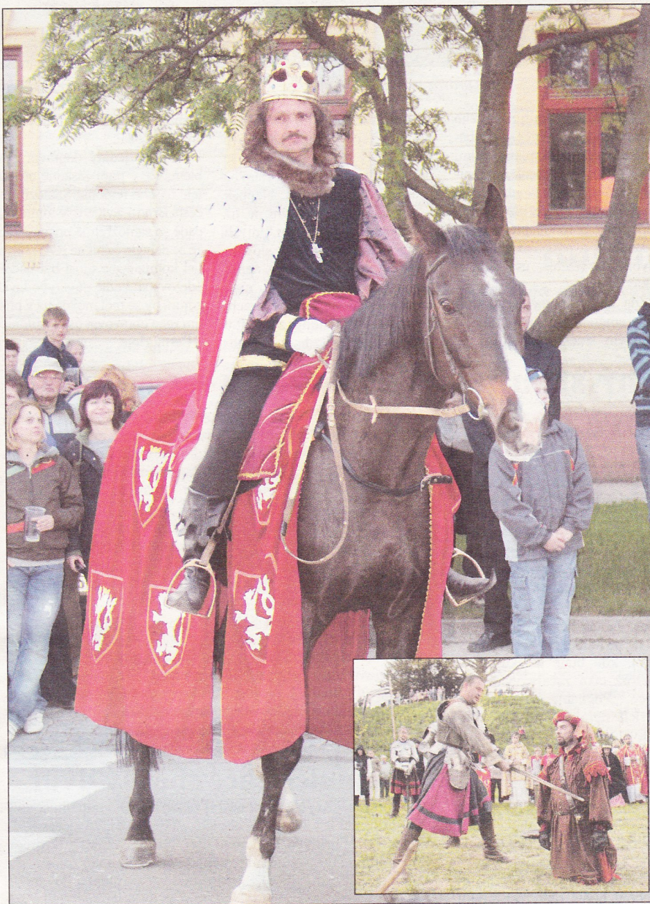
Slavnost. Tisíce lidí dorazily v průběhu soboty do Kunštátu, kde si připomněli 550. výročí korunovace Jiřího z Kunštátu a z Poděbrad českým králem. V průběhu dne se návštěvníkům představila stará řemesla, hudebníci, tanečníci a kejklíři. Vrcholem dne pak byla samotná korunovce.